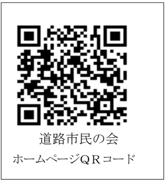
道路市民の会 ホームページQRコード